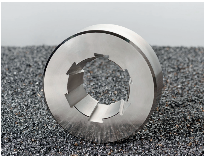
Profil mit T-Nuten. Sonderbauteil für Hydraulikschläuche.