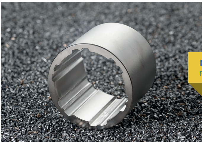
Jedes Wunschprofil ist möglich. Linearführungsbuchse mit Doppelnuten.